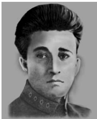
Файзулла Хўжаев (1896–1938) Ўзбекистон ССР Халқ Комиссарлар совети раиси

1937 йил сентябрида Ўзбекистон Компартияси Марказий Комитети III Пленуми бўлди, унда ВКП(б) Марказий Комитетининг секретари А.А.Андреев, И.В.Сталин ва В.М.Молотовларнинг хатини ўқиб беради ва бу хат муҳокама қилинади. Муҳокамада нотиклар бирин-кетин чиқишиб Ўзбекистон Компартияси МКнинг биринчи секретари Акмал Икромовни буржуа миллатчилари ва ўзбек халқининг душманлари Файзулла Хўжаев, Содиқжон Болтабоев, Абдулхай Тожиев, Абдулла Каримов ва