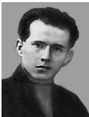
Акмал Икромов (1898–1938) Ўзбекистон Коммунистик Партияси Марказий Комитетининг биринчи секретари

бошкаларга нисбатан сиёсий кўрлик қилганликда айблайдилар. Ҳатто, Акмал Икромов Москвадаги Троцкийчи-ўнгларининг советларга қарши гуруҳини ҳимоя қилганликда айбланган. Пленум Акмал Икромовни Ўзбекистон Компартияси МК биринчи секретари лавозимидан озод қилиш, уни Марказком таркибидан чиқариш, партия сафидан ўчириш ва унинг ишини тергов органларига беришга қарор қилинади.